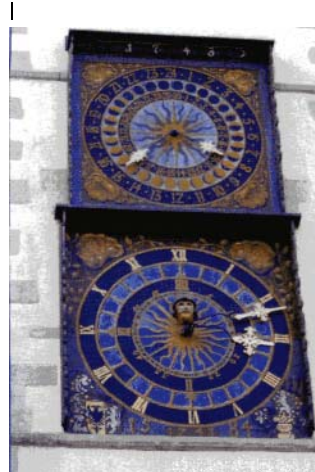
Die Uhren am historischen Rathaus

Theater, Naturkundemuseum, die Städtischen Sammlungen für Geschichte und Kultur mit Kulturhistorischem Museum, Schlesisches Museum,